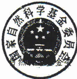
国家自然科学基金委员会