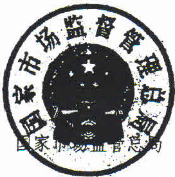
国家市场监督管理总局